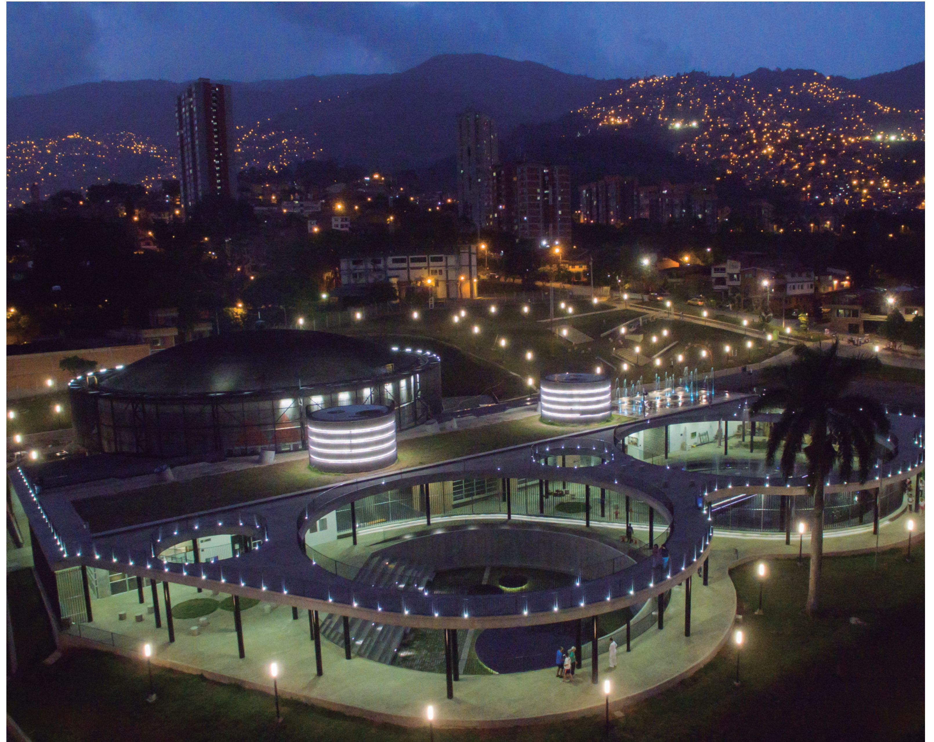
5. RESOLUCIÓN DE APROBACIÓN DE LA JUNTA ADMINISTRADORA LOCAL