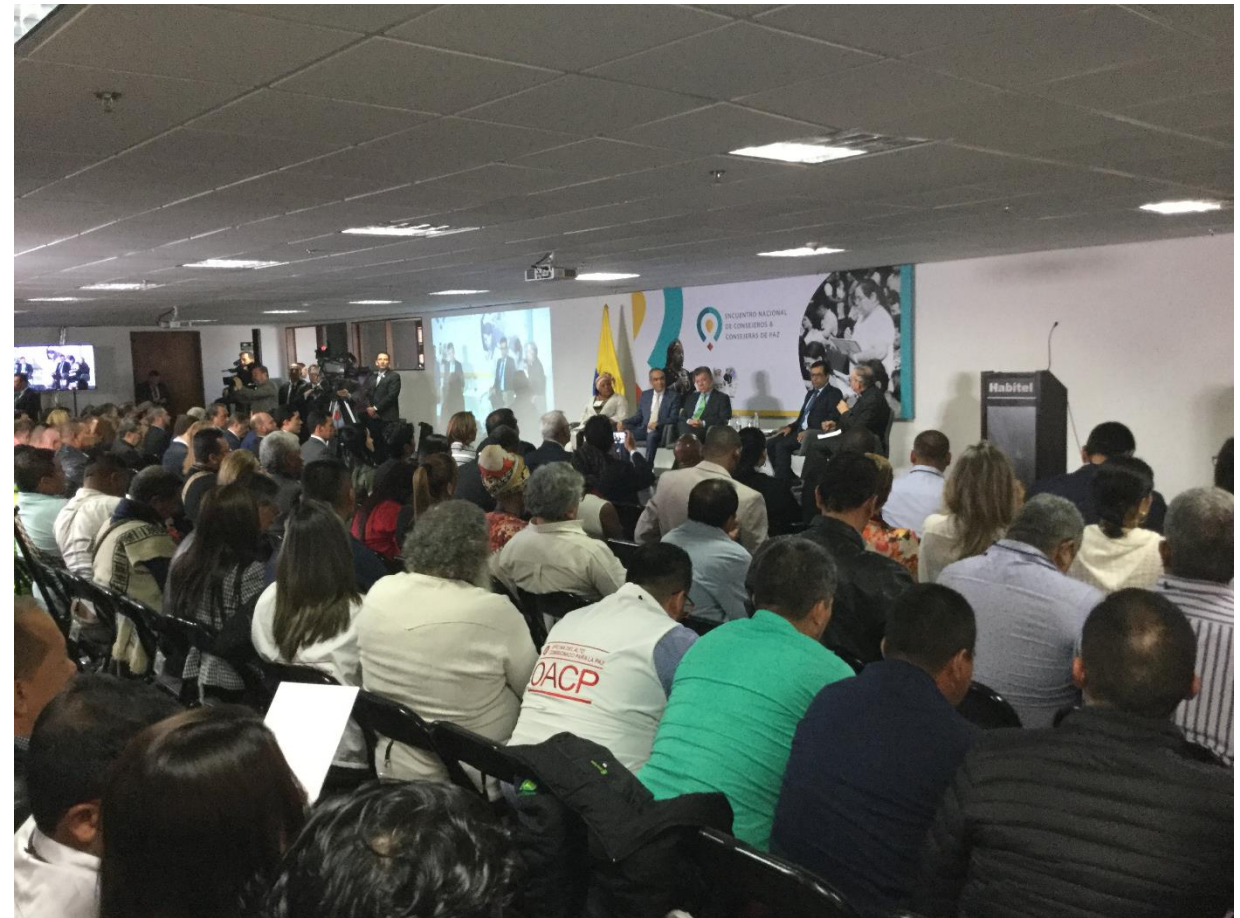
Consejo Nacional de Paz ampliado. Bogotá Agosto 2018