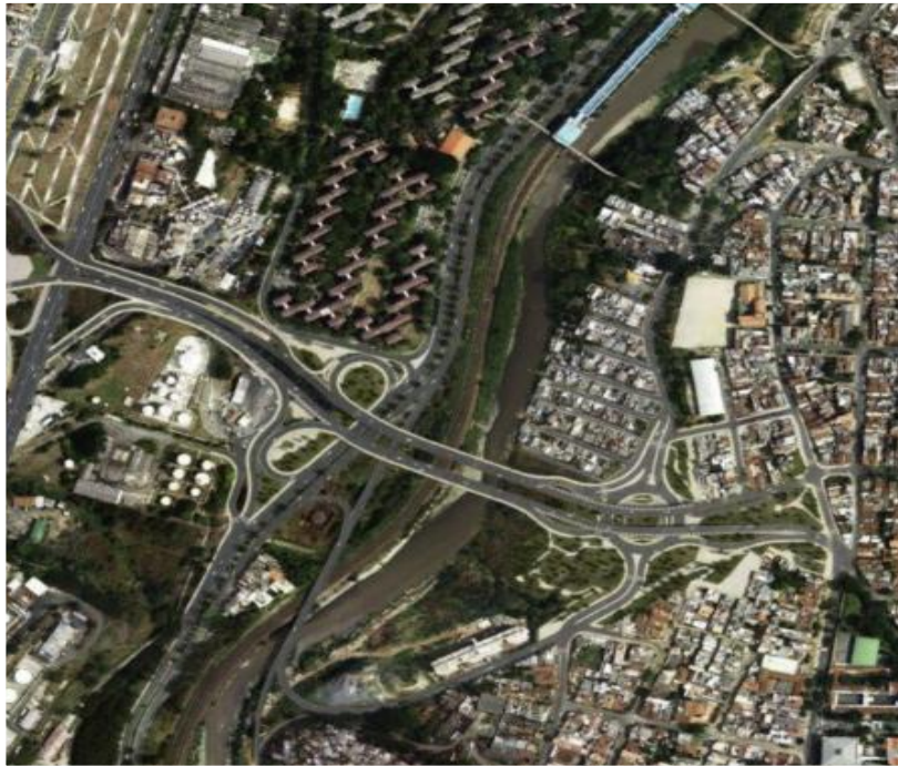
Puente de la Madre Laura