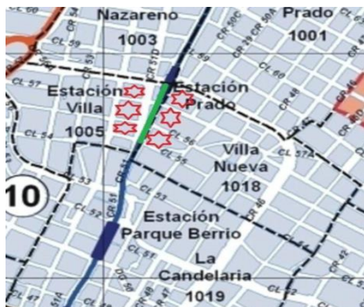
Mapa 1. Ubicación de zonas explotación sexual de niños, niñas y adolescentes del sector Prado Centro de la Comuna 10 (La Candelaria). Las estrellas identifican lugares de residencia. La línea verde, sitios de permanencia.