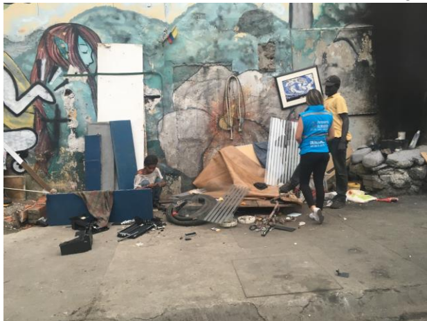
Imagen 8. Visita de verificación de derechos a los habitantes de la calle. Personería de Medellín, 2018.

Medellín se ha convertido en una ciudad receptora de poblaciones desplazadas y migrantes, muchos de los cuales terminan viviendo en las calles. La tendencia actual en la mayoría de las ciudades colombianas es hacia el incremento de una de las poblaciones más desfavorecidas: las personas en situación de calle.