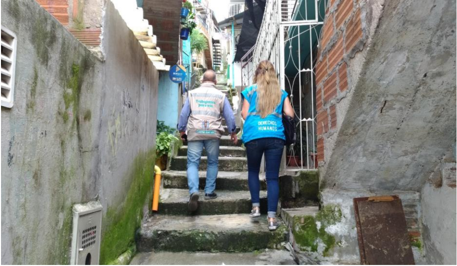
Imagen 6. Visita a la residencia de persona con movilidad reducida en la comuna 6, Doce de Octubre. Personería de Medellín, 2018.

Pero hablar de accesibilidad también obliga a hablar sobre accesibilidad económica. Frente a esto debe precisarse que el 95 % de la población con discapacidad en la ciudad de Medellín se condensa en los estratos 1, 2 y 3 según el mismo Registro de Localización y Caracterización de Personas con Discapacidad del Ministerio de Salud y Protección Social. Lo cual arroja como conclusión que la mayoría de personas en situación de discapacidad en la ciudad de Medellín no solo no tienen una infraestructura pública y vial que los integre a la sociedad para desarrollar su proyecto de vida (educación, empleo, recreación, etc.), sino que, además, pertenecen en su mayoría a los estratos socioeconómicos más bajos de la población, lo que los hace más vulnerables aún al dificultarles el pleno acceso a la canasta familiar básica y servicios públicos domiciliarios.