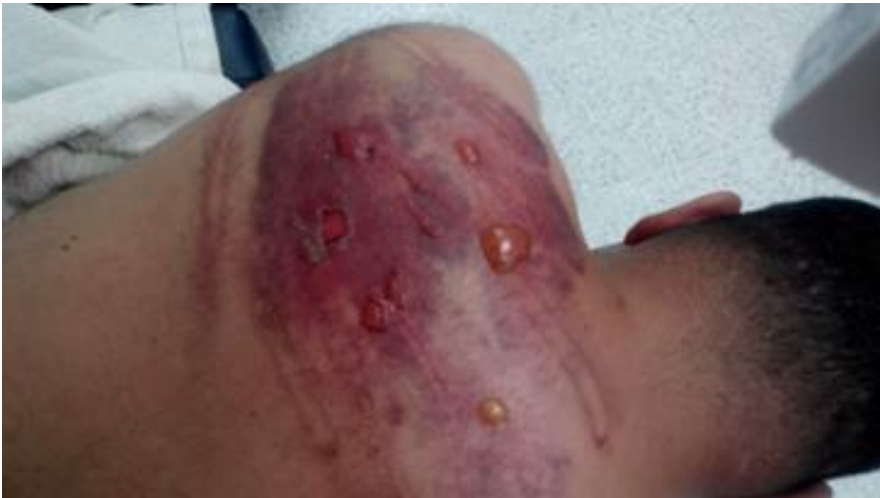
Imagen 1. Persona privada de la libertad que fue expuesta varias horas al sol como sanción disciplinaria por presuntamente promover una gresca interna.

(...) el 4 de enero de 2018 fue golpeado (interno de Castilla) brutalmente por (funcionario) del Esmad, el daño fue tan grave que estuvo en la Clínica León XIII (sic); en la estación nunca le avisaron a la familia de este incidente, se enteró porque había una amiga en urgencias en la clínica y llamó a contar. La usuaria de inmediato se fue para ver qué había pasado y le tomó fotografías. (Personería de Medellín, 2018)