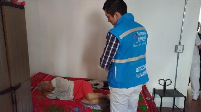
Imagen 7. Visita de verificación a Centro de Protección al Adulto Mayor. Personería de Medellín, 2018.

Centros de Protección al Adulto Mayor de la ciudad con el fin de identificar posibles irregularidades que vulneren los derechos de la población albergada. Mediante las visitas realizadas a estos hogares, se identificó que aproximadamente el 98 % de estos cumplen a satisfacción con los requerimientos exigidos por ley para el buen funcionamiento, manutención y atención a la población mayor. En contraste, gracias a los recorridos realizados por los centros gerontológicos privados, la Personería halló en mayor número el escaso cumplimiento de los requerimientos técnicos para la buena prestación de este servicio, entre otras razones, por el incompleto equipo profesional para la atención al usuario, mobiliario inadecuado, alimentación irregular y deficiencias estructurares, como falta de medidas de accesibilidad.