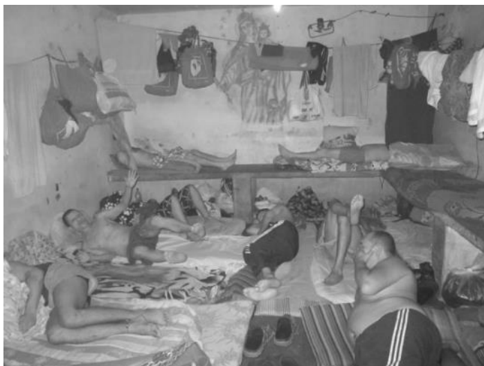
Imagen 4. Espacios sobrepoblados, con hacinamientos superiores al 400 %; en promedio, el área de habitabilidad por interno fue de 1.5 m 2 y, en algunas salas, se llegó a registrar espacios entre 30 y 60 cm 2 .

La superficie disponible para las salas “de paso” de las estaciones de policía en el Área Metropolitana del Valle de Aburrá es de 735,5 m 2 , para un uso de 255 personas, según informe oficial de la entidad. El promedio de hacinamiento en la ciudad de Medellín durante el año 2018 fue de 430 %, debido a que las ocupaciones estuvieron entre los 1000 y 1100 PPL.