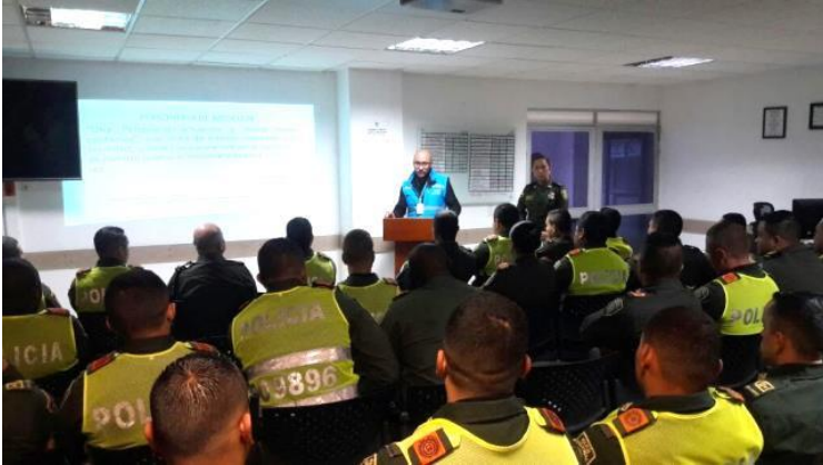
Imagen 2. Sensibilización y capacitación a personal uniformado de Policía Nacional ante hallazgos de tratos degradantes a PPL en estaciones de policía.

Asimismo, se reseñó el desconocimiento sobre el protocolo de inspección corporal en procedimientos de registro y control a población reclusa, evidenciado en actos como desnudar a la población detenida y efectuar requisas intrusivas, generando manipulación en sus zonas íntimas, cuando no era necesaria por existir otros mecanismos para garantizar la seguridad.