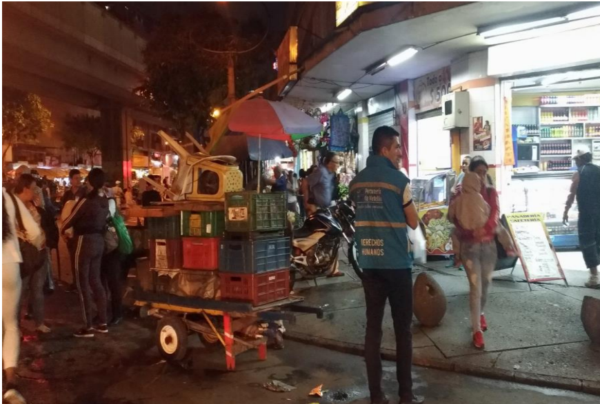
Imagen 5. Invasión del espacio público por parte del comercio informal. Personería de Medellín, 2018.

Así, por ejemplo, se ha podido evidenciar que, si bien la Administración ha realizado adecuaciones de diferentes zonas de la ciudad para que tengan mayor accesibilidad, persiste una parte importante sin contar con condiciones adecuadas, a lo que se suma no solo las limitaciones de infraestructura, sino otros fenómenos tales como el uso indebido del espacio público, que en muchas ocasiones es utilizado para el comercio informal, bloqueando justamente los accesos para persona con discapacidad, todo lo cual plantea que la conjugación de la limitada infraestructura con la indolencia de la comunidad es la mayor barrera que tienen que afrontar las personas con discapacidad para la materialización de sus derechos.