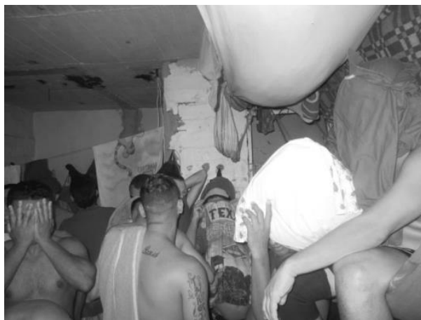
Imagen 3 Uso improvisado de espacios con cobijas y sábanas en techos y paredes.

Elaborado por la Personería de Medellín.